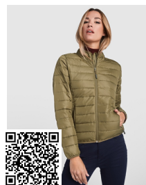
FINLAND WOMAN RA5095