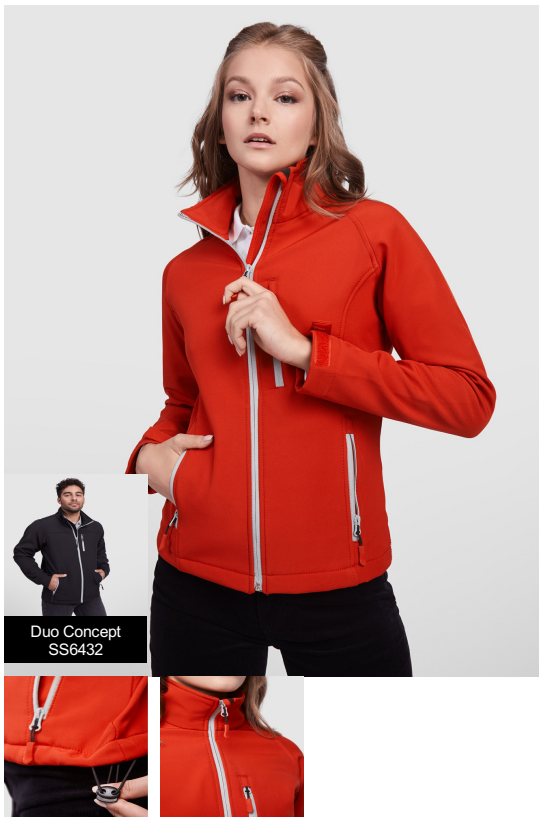
Duo Concept SS6432