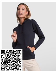
URBAN WOMAN SU1068