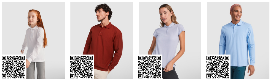
CARPE CHILD PO5008