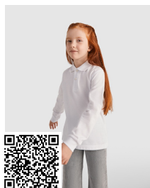
CARPE CHILD PO5008