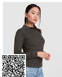
ESTRELLA WOMAN L/S PO6636