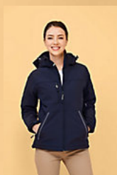
SOL'S ROCK WOMEN 46804