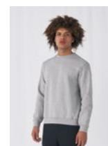
EXISTE EN UNISEX: B&C SET IN