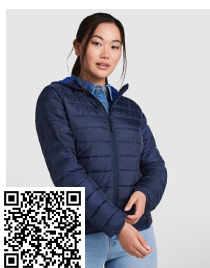
NORWAY WOMAN RA5091