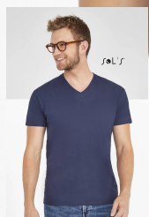
IMPERIAL V MEN 02940